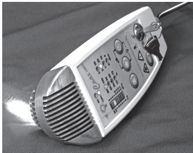
Рис. 1. Внешний вид аппарата магнитолазерного терапевтического “Снаг”.

В настоящее время для реализации терапевтического действия лазерного излучения в различных фототерапевтических технологиях используются аппараты, работающие в непрерывном режиме с мощностью излучения от P_{\text{ср}}^{\text{макс}} = 2\text{--}5 мВт ( \lambda = 635\text{--}675 нм, красная область спектра) до P_{\text{ср}}^{\text{макс}} = 7,5 Вт ( \lambda = 980 нм, лазер IV класса по степени опасности генерируемого излучения производства Avicenna Laser Technology Inc., США). Причем указанный высокомогущий лазер стоимостью порядка